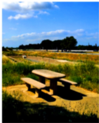
Le grain de l'ivraie - 2021 Installation sonore et vidéo